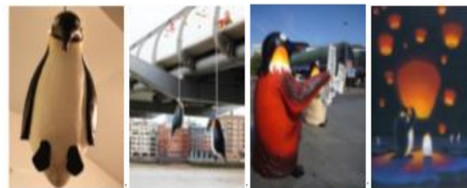
↓ 黃瑞芳作品 ↓

他的作品表示方式創新, 很容易吸引別人注目。他的其中一份經典作品是《上吊死諱的企鵝》, 曾於倫敦千禧橋懸掛著, 意指企鵝受到全球暖化的影響上吊自殺, 生不如死, 明顯帶出了生態系統問題。他的作品裏都喜愛以企鵝作為主角, 因為黃瑞芳認為鵝是一個最能代表生態的動物。他的裝置藝術作品很多是用來警告世暖化危機。 ↓